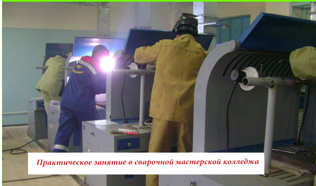
Практическое занятие в сварочной мастерской колледжа